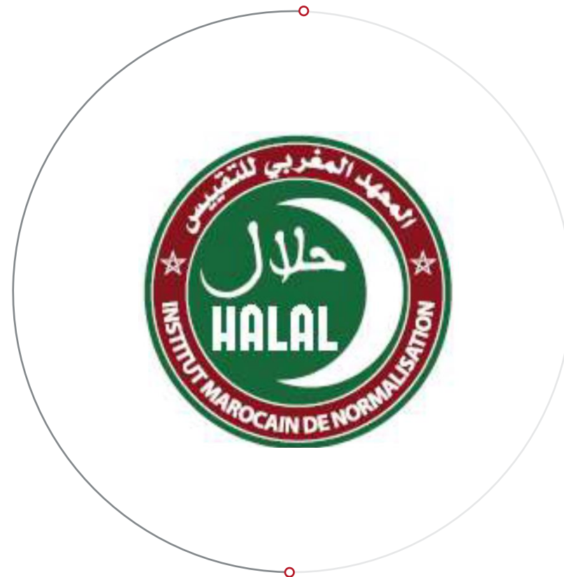
Logo HALAL nadawane przez IMANOR