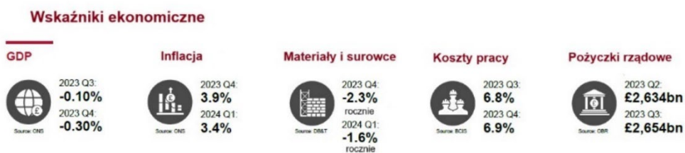
Rys 2.

Najsilniejszym podsektorem budowlanym w Wielkiej Brytanii pozostaje infrastruktura. Tylko do 2025 roku rząd brytyjski wydał w tym obszarze 127,4 miliarda dolarów. Warto zaznaczyć, że aż około połowa inwestycji infrastrukturalnych w Wielkiej Brytanii jest finansowana ze środków publicznych 3 .