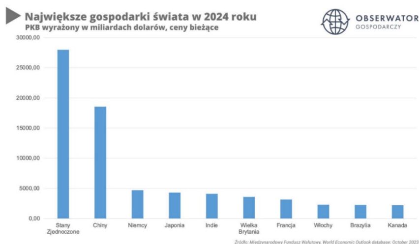
Rys.1 Największe gospodarki świata w 2024 r. Międzynarodowy fundusz walutowy „World Economic Outlook database (December 2023)

Poniższe informacje są skondensowaną dawką konkretnych danych oraz potwierdzonych prognoz rządowych dla branży budownictwa. Stanowią one wyraźny obraz obecnych warunków gospodarczych dla całego sektora.